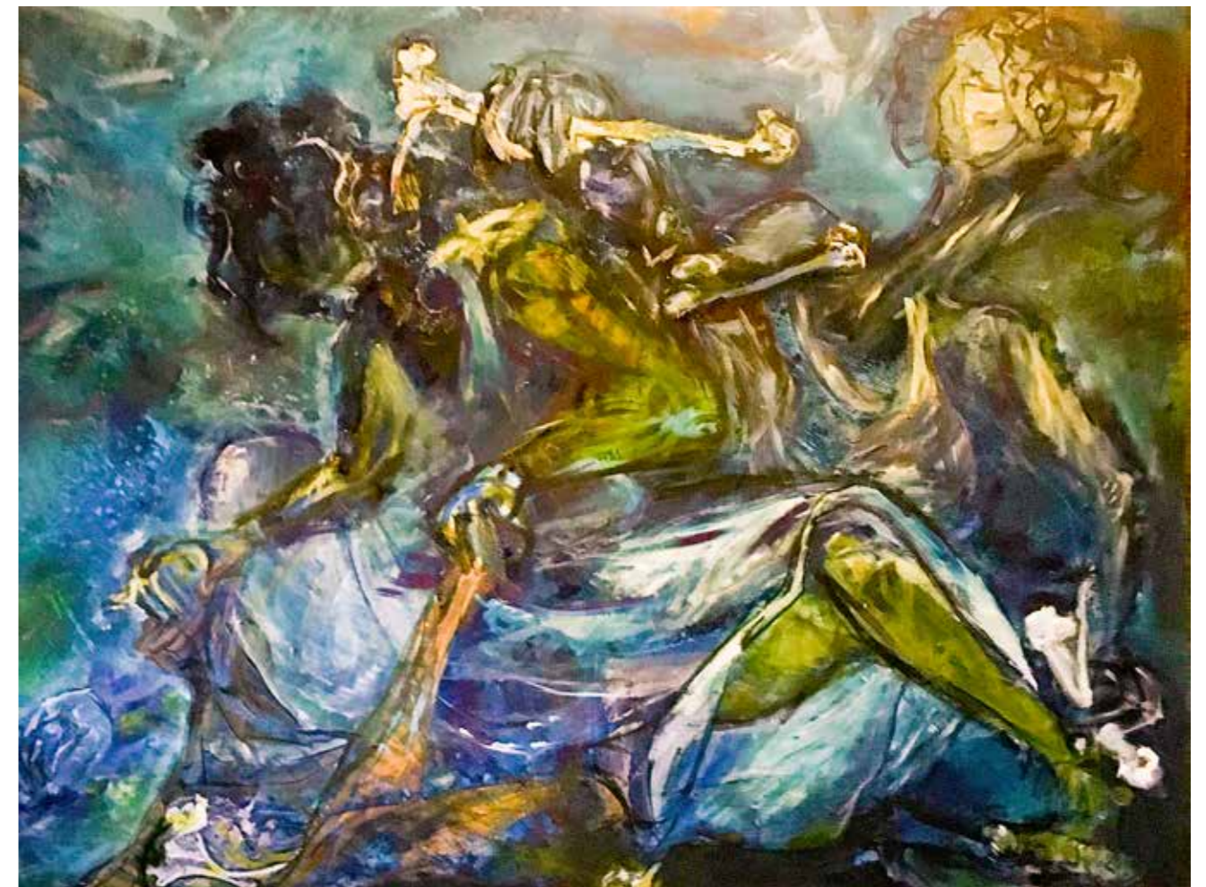
„Sarah says“ nach einer Butoh - Performance, Acryl auf LW 120 × 160 Sept.19 /März 20