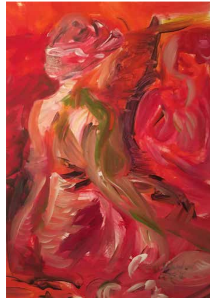
„rote“ Acryl auf LW 70 × 50 3.5.2016