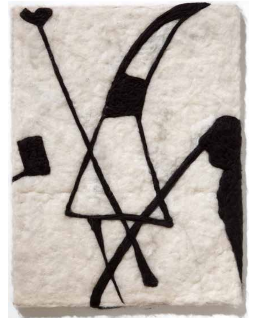
JAGDSZENE 1, Rohwolle und gekämmtes Bergschaf, 50 x 70 cm

2020 WAS IST WAS WAR - Werkschau in Neu Tramm Dannenberg