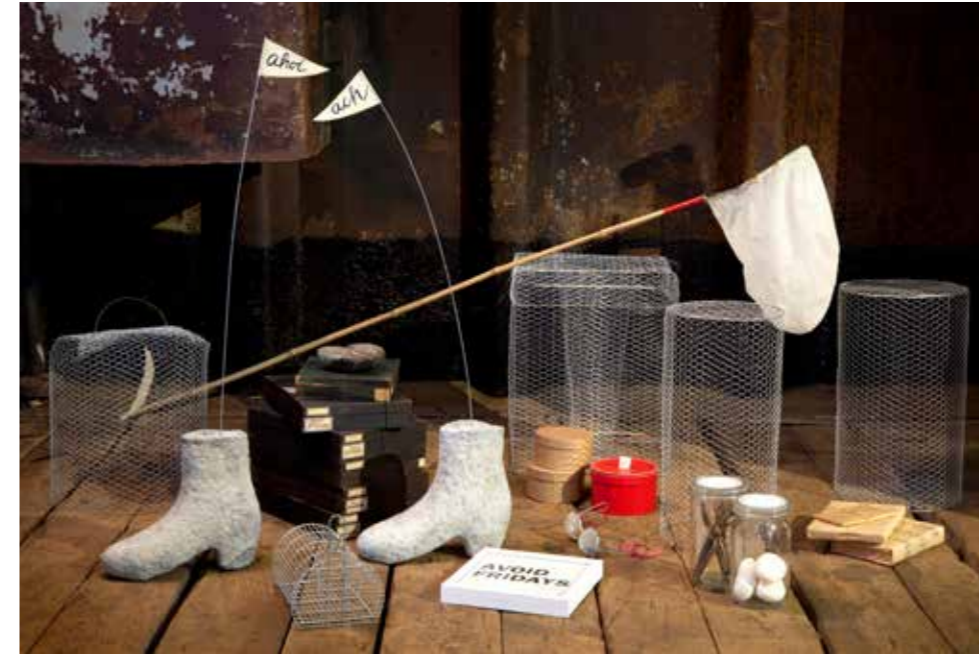
DIE GROSSE ÜBERFAHRT ... 2014 . Installation . verschiedene Materialien . Foto Rainer Erhard