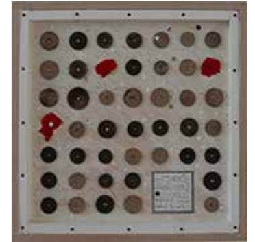
DER SINN DES LEBENS 2. VERSUCH ... 2020 Holzkasten mixed Media 30 x 30 cm