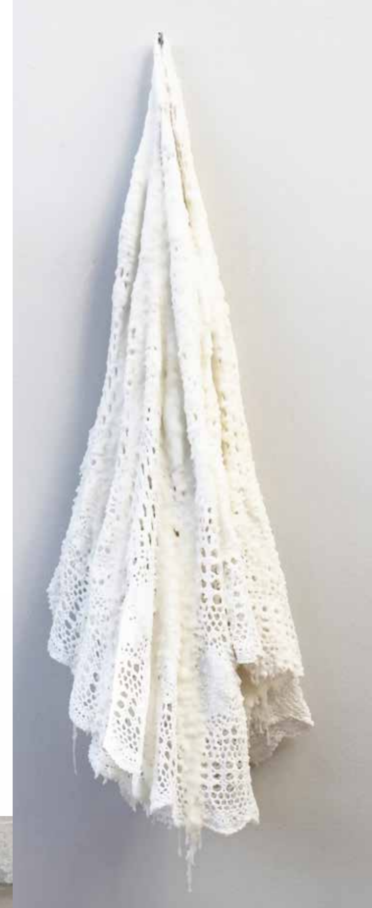
o.T. Wandobjekte, 2024, Filz, wachs, je 17 x 17 cm