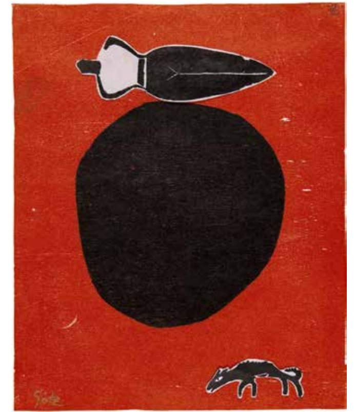
SUCH MICH MAL! Farbholzschnitt auf Japanpapier, Cutout/Colla- ge Unikat, 24 x 30cm, 2014