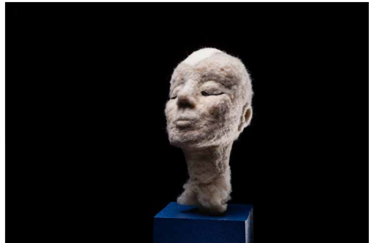
MÄDCHENKOPF 1 Rohwolle, 30 x 22cm