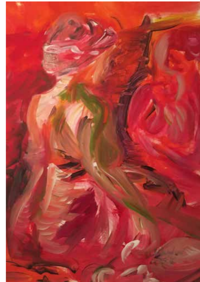
„rote“ Acryl auf LW 70 × 50 3.5.2016