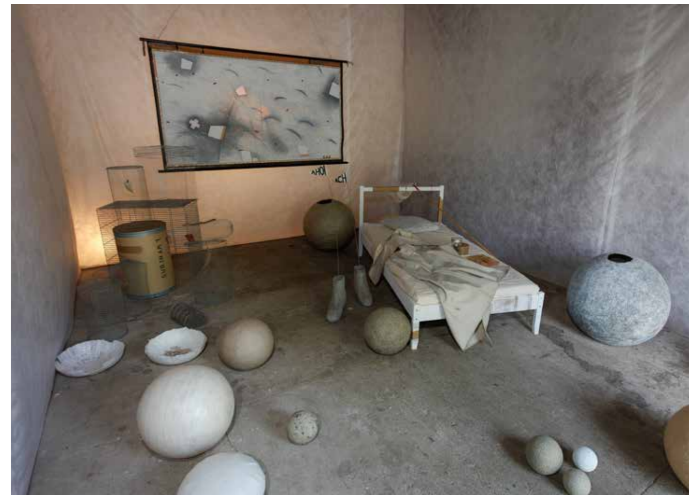
VON DER GLÜCKSELIGKEIT ALLES ZU WISSEN . 2017 . DAS SURINAMPROJEKT (Ausschnitt) . verschied. Materialien . Installation . Foto Timo Vogt