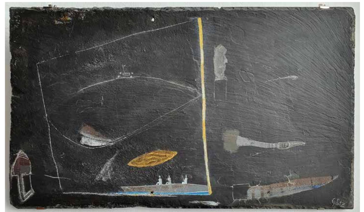
DREI IN EINEM BOOT Ritzung/Acryl auf Schiefer, ca 35 x 61 cm, 2020