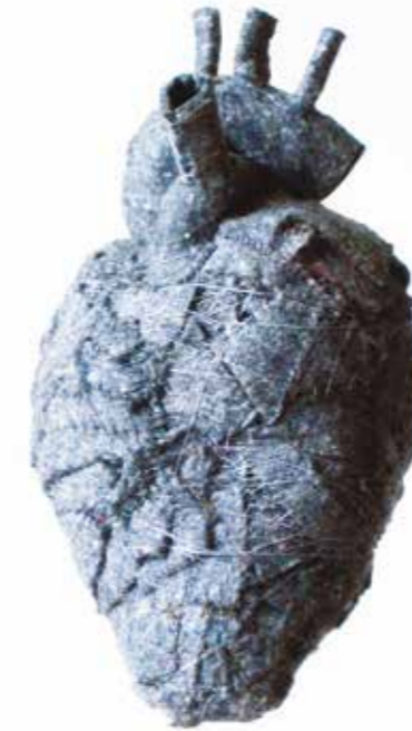
coeur, 2007, Filz, Garn, 70 x 17 x 13 cm o.T. Wandobjekt, 2018, Häkeldecke, Wachs, 130 x 50 cm o.T. Wandobjekt, 2022, Filz, Wachs, 25 x 100 x 20 cm o.T., Objekte, 2023, Filz, Wachs, variierend je 5 x 20-50 cm

1961 geboren in Stuttgart 1981 - 86 Studium Visuelle Kommunikation und Germanistik Gesamthochschule Kassel Theaterarbeit konkrete und visuelle poesie 1986 Erstes Staatsexamen 1986 - 1987 Praktikum Bereich Bühnenbild Staatstheater Kassel Mitarbeit im Organisationsteam der documenta 8 1987 - 1989 Referendariat und zweites Staatsexamen in Lübeck seit 1989 Teilzeit an Lübecker Gymnasien im Fach Kunst parallel dazu künstlerische Arbeit in den Bereichen Zeichnung, Druckgrafik, Fotografie, Objekt und Installation 1990 - 2000 außerschulische Jugendkulturarbeit LAG Kunst S-H 2017 - 2020 Wissenschaftliche Mitarbeiterin der Universität Vechta 2020 Umzug in den Kreis Lüchow-Dannenberg ( Langendorf ) seither freischaffend 2022 Gründung der Produzentengalerie KUNST UND GUT in Langendorf Zahlreiche Ausstellungen im Bundesgebiet