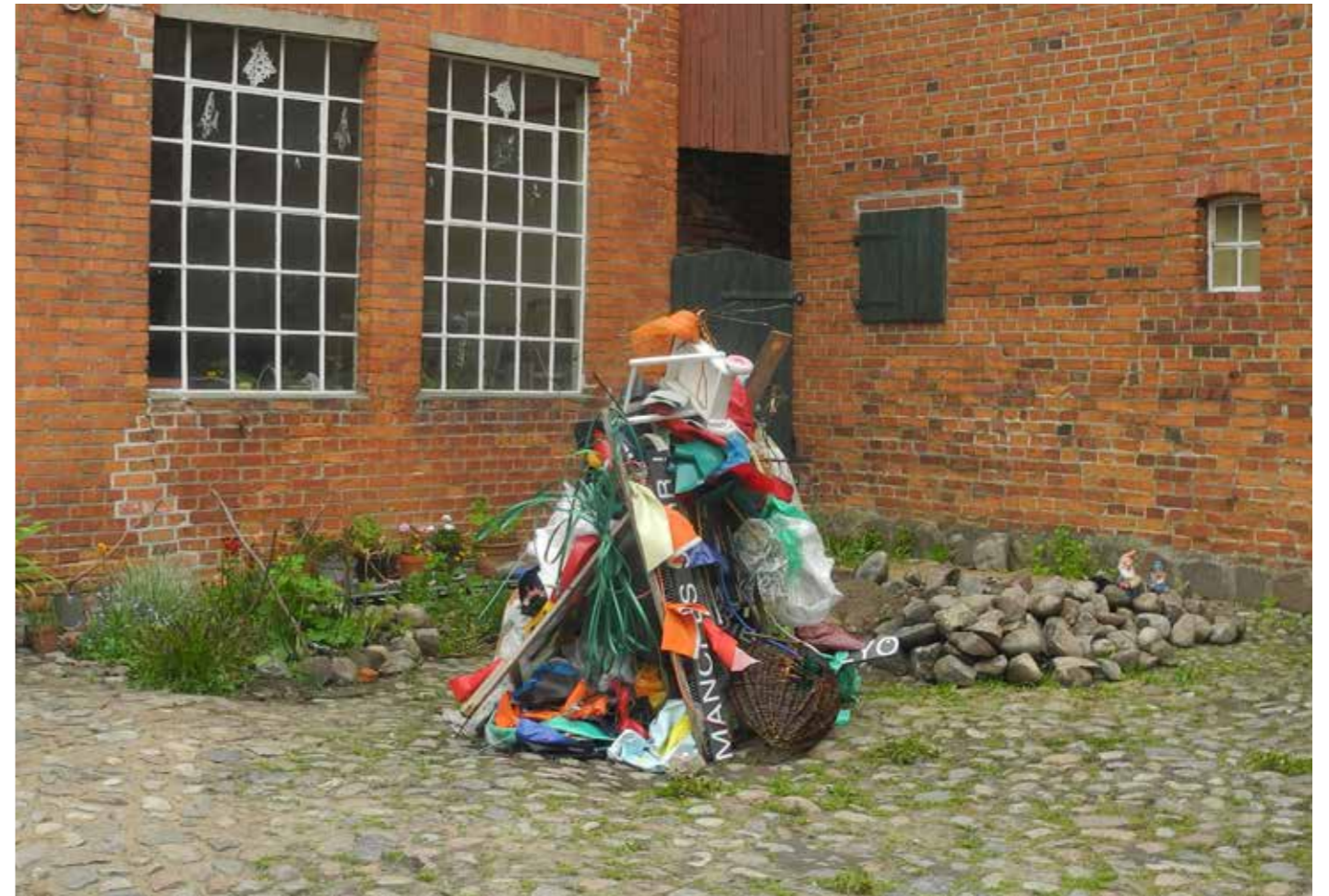
EIN WILDER HAUFEN verschiedene Materialien, Maße variabel