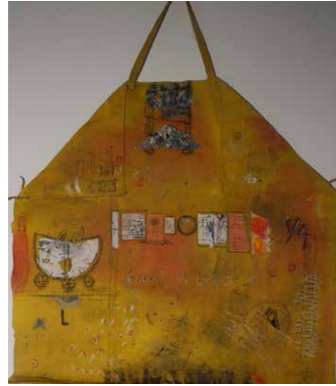
MEHL UND BUTTER mixed media auf alter Leinenschürze 100 x 90 cm

angenommen an der Malta-Biennale, La Valetta/Malta, nicht teilgenommen (2024)