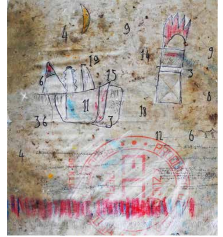
ZUCKER AUS KUBA Ölstift und Acrylmarker auf altem Zuckersack 90 x 80 cm